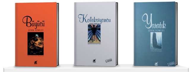
Büyücü John Fowles Ayrıntı Yayınları

"Yazacağım kitapların hepsinin sonunu bilirim, çatısını oluşturduktan sonra mutlaka bir kenara bırakırım ve bir kahve gibi demlenmesini beklerim. Eser güç toplar, tatlanır ve gerisi gelir..." ■