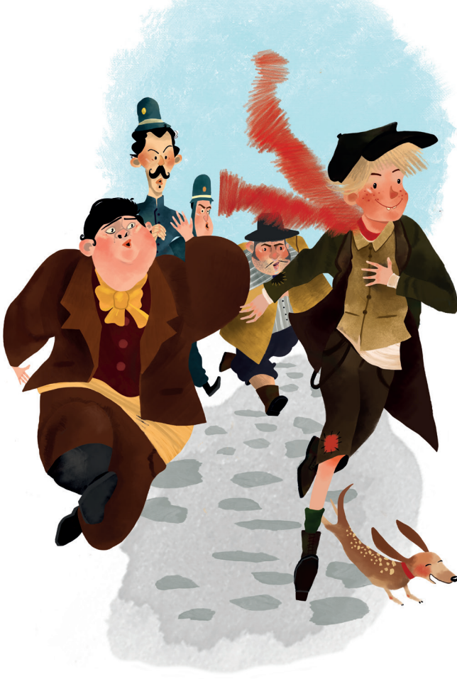
Çizim: Zeynep Dağgüden