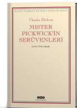
Mister Pickwick'in Serüvenleri Charles Dickens Çev.: Tektaş Ağaoglu Yapı Kredi Yayınları